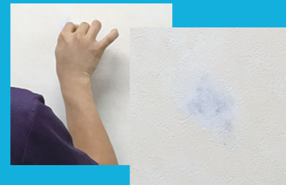
クレパスで下地塗り