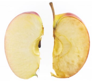
リンゴが茶色くなるのも酸化が原因です。